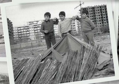
Els Pins.