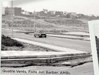
Quatre Vents.