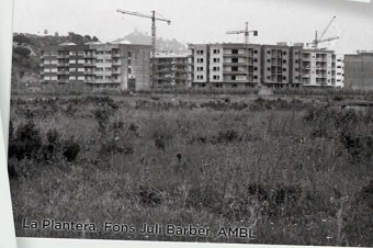
La Plantera.