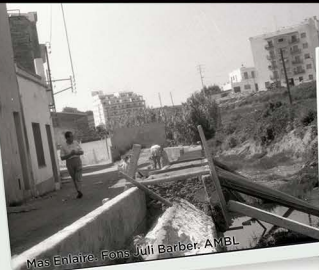
Mas Enlaire.