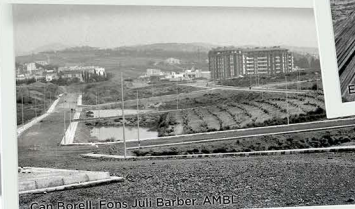
Can Borell. Fons Juli Barber. AMBL