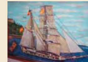
1 • Col·lecció F. Payret

Els americanos o indians eren les persones que havien emigrat a Amèrica de joves i al cap dels anys tornaven als seus llocs d'origen més o menys enriquits, havent assolit un cert ascens econòmic i social.