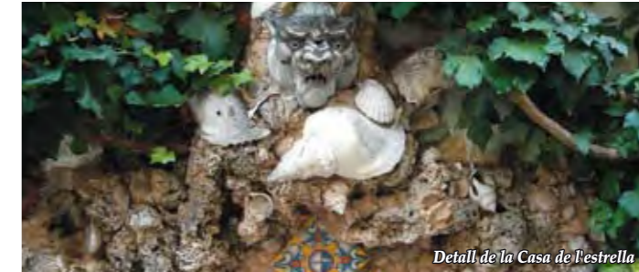
Detall de la Casa de l'estrella