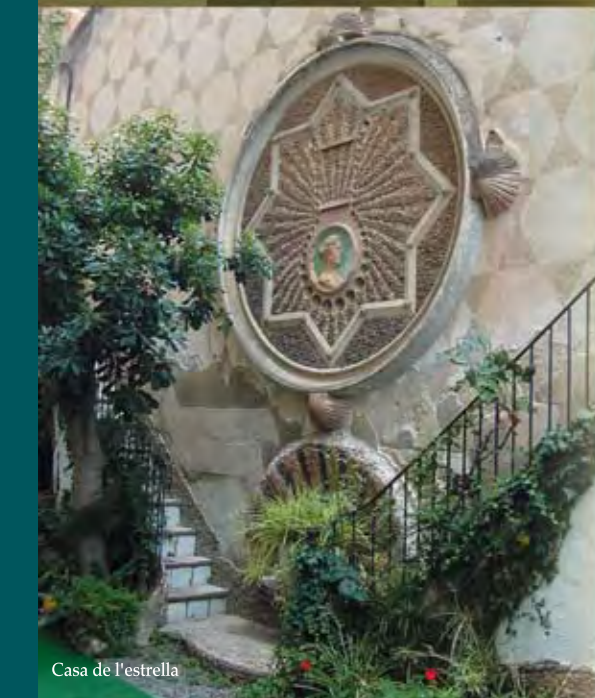
Casa de l'estrella