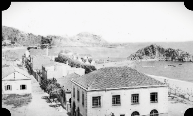
El col·legi de la Vila, fa 100 anys.

L'escola de la Vila és un dels equipaments públics més emblemàtics i de més interès de Blanes. Aquesta especificitat la deu a diversos factors. En primer lloc, es tracta del col·legi públic més antic del poble. Això li atorga un important valor afegit ja que en la seva dilatada trajectòria hi ha reflectits tant els canvis en els models de l'ensenyament públic com els canvis de la societat on està inserida. A més, si tenim en compte que la Vila és l'hereva directa del sistema escolar municipal que es va anar assentant des del primer terç del segle XIX, podem afirmar que, com a institució d'ensenyament, és la més antiga de les vigents a Blanes. Per tant, ha estat la responsable de la formació d'un munt de generacions de blanencs i blanenques.