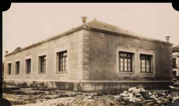
L'edifici el 1925. Autor desconegut. Arxiu Municipal de Blanes (AMBL)

A principi de segle XX l'ensenyament públic es rebia a l'escola municipal-nacional per a nois, a la de noies i a l'acadèmia del Sr. Duran anomenada de Sant Josep. Aquesta acadèmia rebia subvenció municipal i, entre d'altres coses, feia classes nocturnes per a adults. Pel que fa a les escoles privades, per a les noies hi havia el Cor de Maria i per als nois el col·legi Santa Maria, ambdues amb una llarga tradició i reconeixement al darrere. A banda d'això, el Centre Catòlic i el "Sindicat Agrícola" des de 1914 organitzaven classes nocturnes per a adults; unes classes que majoritàriament eren seguides per terrassans. Com és obvi, les diferències entre unes i altres estaven relacionades amb la possibilitat familiar d'atendre o no el pagament requerit pels centres. Això condicionava decisivament l'alumnat cap un lloc o altre. Fins i tot, en les escoles públiques la gratuïtat era quelcom difícil d'aconseguir atès que no es podien sufragar totes les despeses de mestres i material. Només en quedaven exemptes les famílies pobres que certifiqessin la inexistència de recursos.