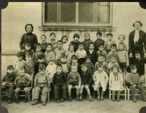
Grup Escolar. Any 1933 c.

L'escola de la Vila és un dels equipaments públics més emblemàtics i de més interès de Blanes. Aquesta especificitat la deu a diversos factors. En primer lloc, es tracta del col·legi públic més antic del poble. Això li atorga un important valor afegit ja que en la seva dilatada trajectòria hi ha reflectits tant els canvis en els models de l'ensenyament públic com els canvis de la societat on està inserida. A més, si tenim en compte que la Vila és l'hereva directa del sistema escolar municipal que es va anar assentant des del primer terç del segle XIX, podem afirmar que, com a institució d'ensenyament, és la més antiga de les vigents a Blanes. Per tant, ha estat la responsable de la formació d'un munt de generacions de blanencs i blanenques.