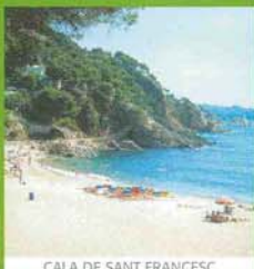
CALA DE SANT FRANCESC