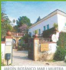
JARDÍN BOTÁNICO MAR I MURTRA