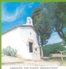
ERMITA DE SANT FRANCESC