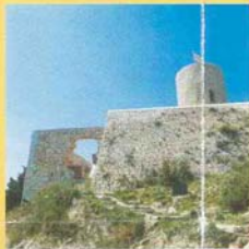
CASTILLO DE SANT JOAN