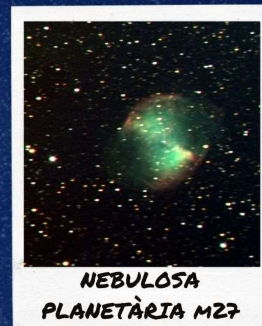
NEBULOSA PLANETÀRIA M27