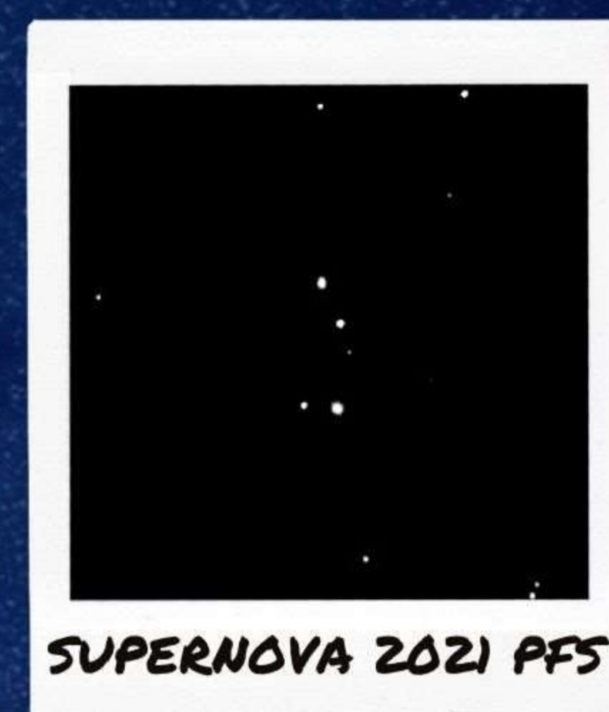
SUPERNOVA 2021 PFS

UNA INTRODUCCIÓ A L'ASTRONOMIA A TRAVÉS DE L'OBSERVACIÓ